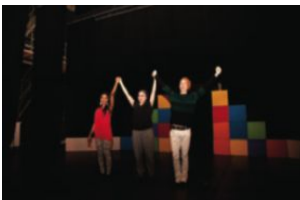
“Vi har tagit studenten, vi har tagit studenten...”. Musikalen handlar om steget bort från föräldrar och traditioner.