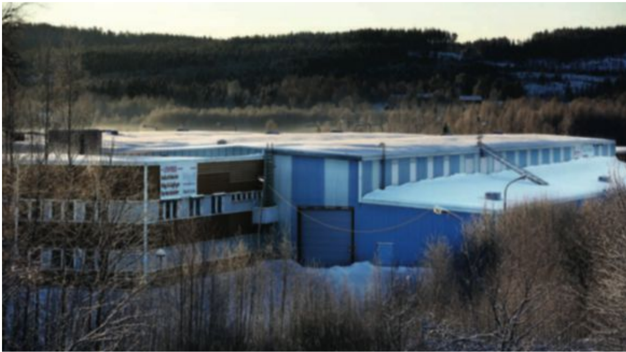
Dagabs gamla lager här i Ålandsbro marknadsförs nu som lämplig lokal för dataserverhall.