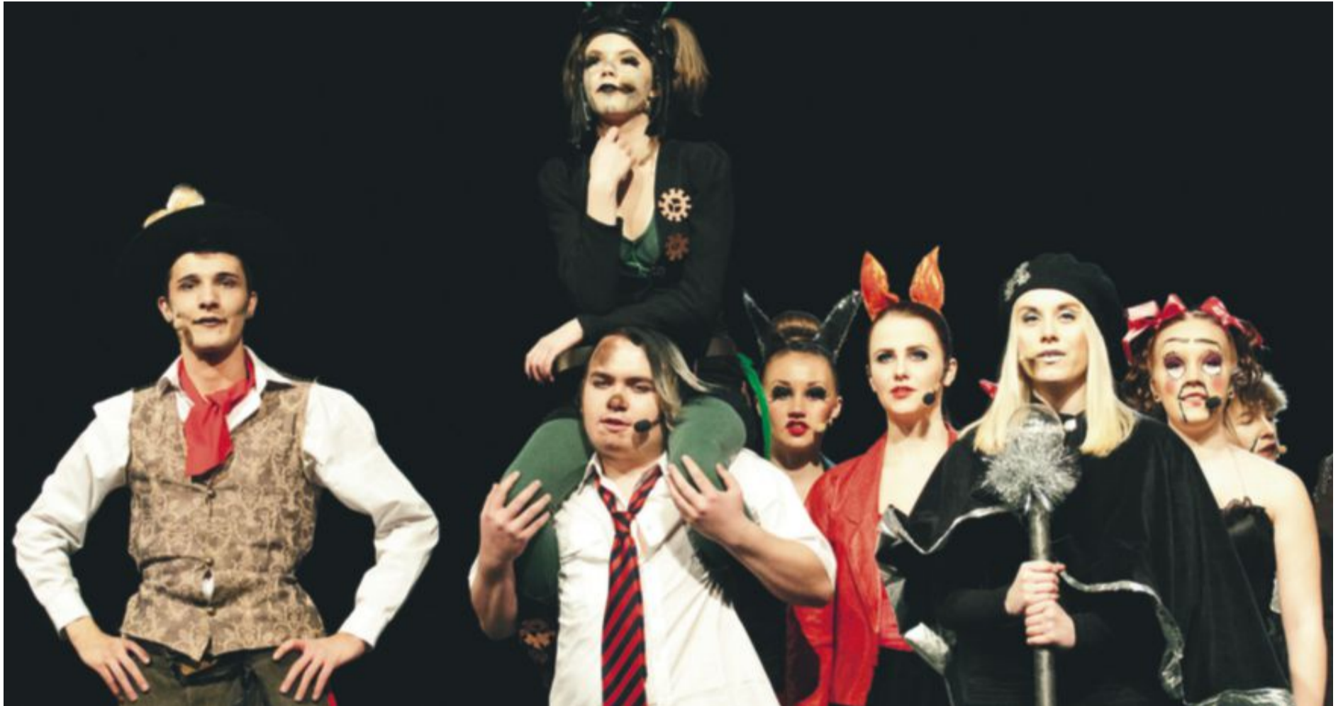
Upptakten till föreställningen som estetiska programmet på Ådalsskolan anordnat.