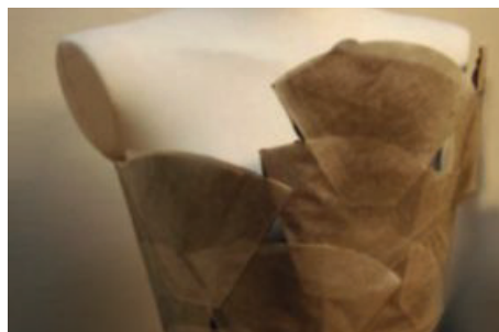
Topp av kaffefilter gjord av Katarina Sundberg.