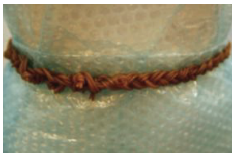
Matilda Büstedt gjorde ett skärp av colaremmar.