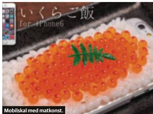
Mobilskal med matkonst.

■ Mobilversionen av Microsoft Office är i dag helt gratis för alla men inom kort blir det ändring på det. Microsoft har beslutat att de som använder en mobil enhet med en skärm på 10,1 tum eller mer ska betala en avgift, något som betyder att främst surfplattor för professionellt bruk drabbas men även en hel del andra modeller för den delen. Du som exempelvis har en Ipad behöver däremot inte oroa dig eftersom dessa har en skärm på 9,7 tum eller mindre.