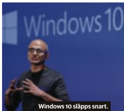
Windows 10 släpps snart.