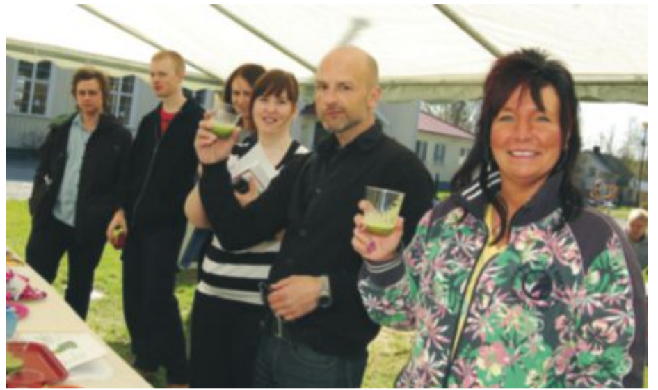
Tolv elever från vitt skilda delar av landet nappade detta år på den ettåriga hälsocoachutbildningen som Hola folkhögskola bedrivit i fyra år.