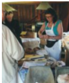
Surdegsbröd och kanelbullar var en del av lockelserna på Skogs-Hildas hörna under Vitsippans Dag.