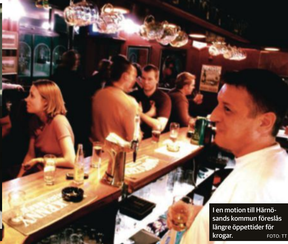
I en motion till Härnösands kommun föreslås längre öppettider för krogar.