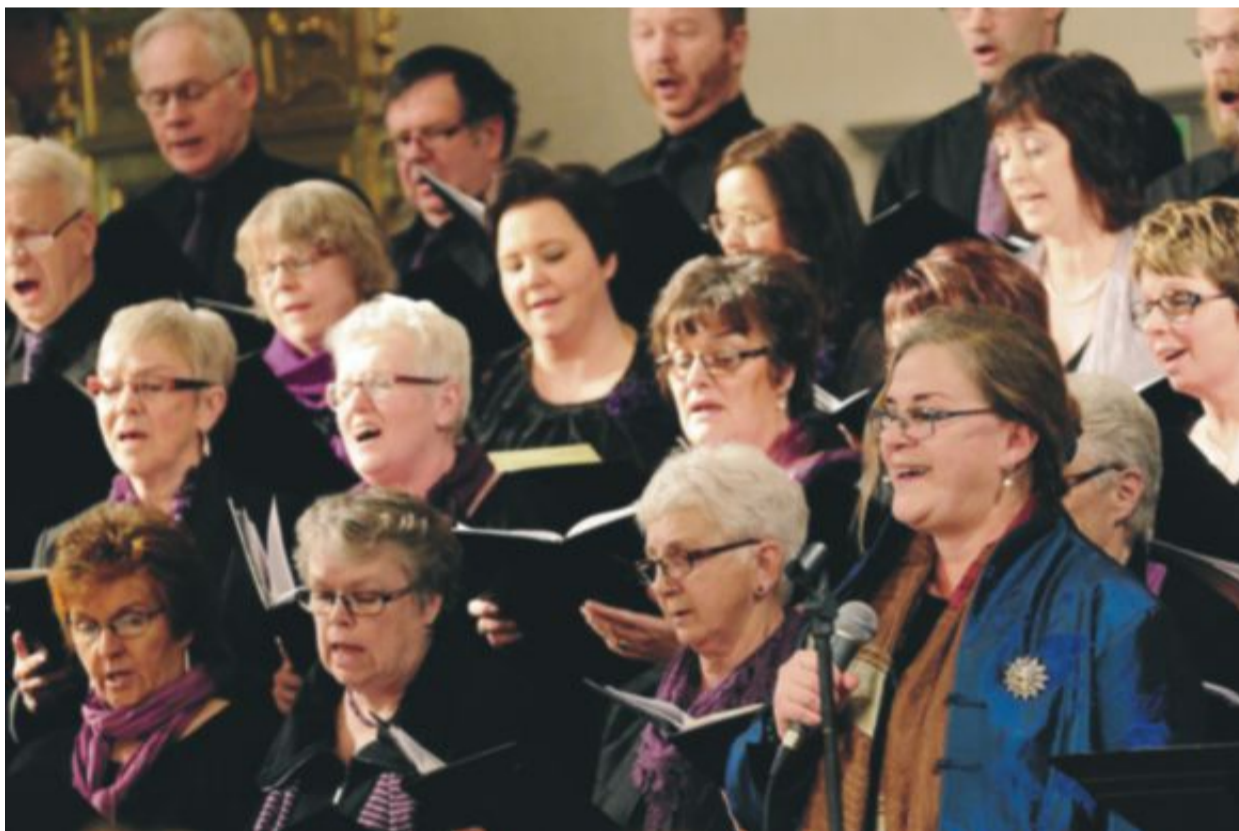
Finstämd kyrkokör fyllde Nordingrå mäktiga kyrka.