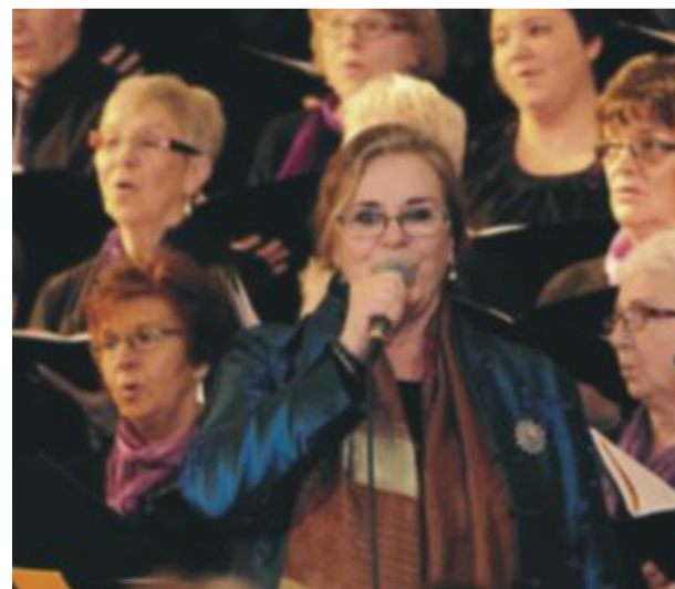
Rockartisten Py Bäckman har inte en tanke på att sluta uppträda, kalendern är mer fullpackad än någonsin.