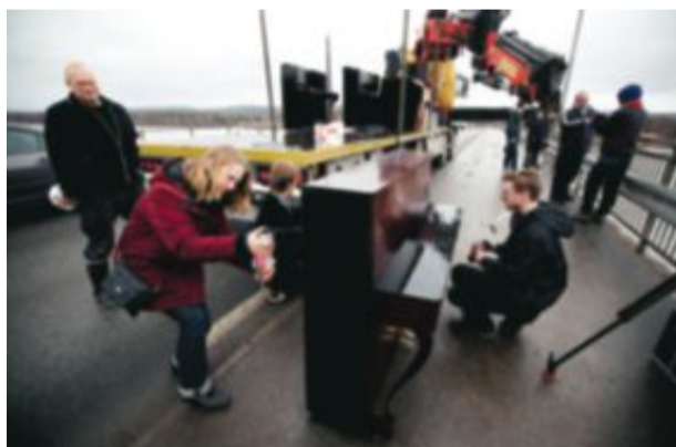
Teknikstudenter från Ådalsskolan, musikstuderande från Kapellsbergsskolan och många andra fanns på plats under onsdagens idoga pianokraschande.