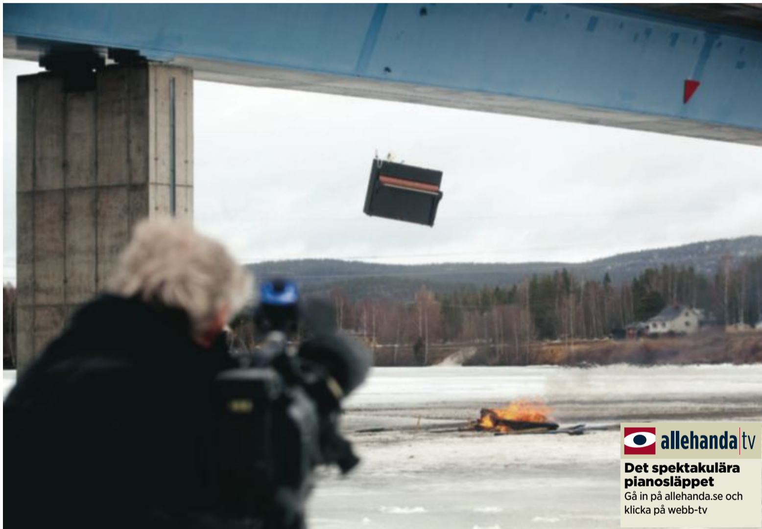
Pianot faller fritt några sekunder innan det krossas mot isen under Hammarsbron.

"Ice Concerto" är en blandning av dans, musik och film. Premiären äger rum i november i Umeå med bland annat världspianisten Niklas Sivelöv och Norrlandsoperans symfo-