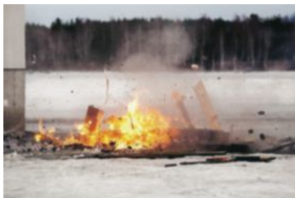
Innan de hissas upp fylls alla pianon med bensin så att de ska explodera när de kraschlandar.